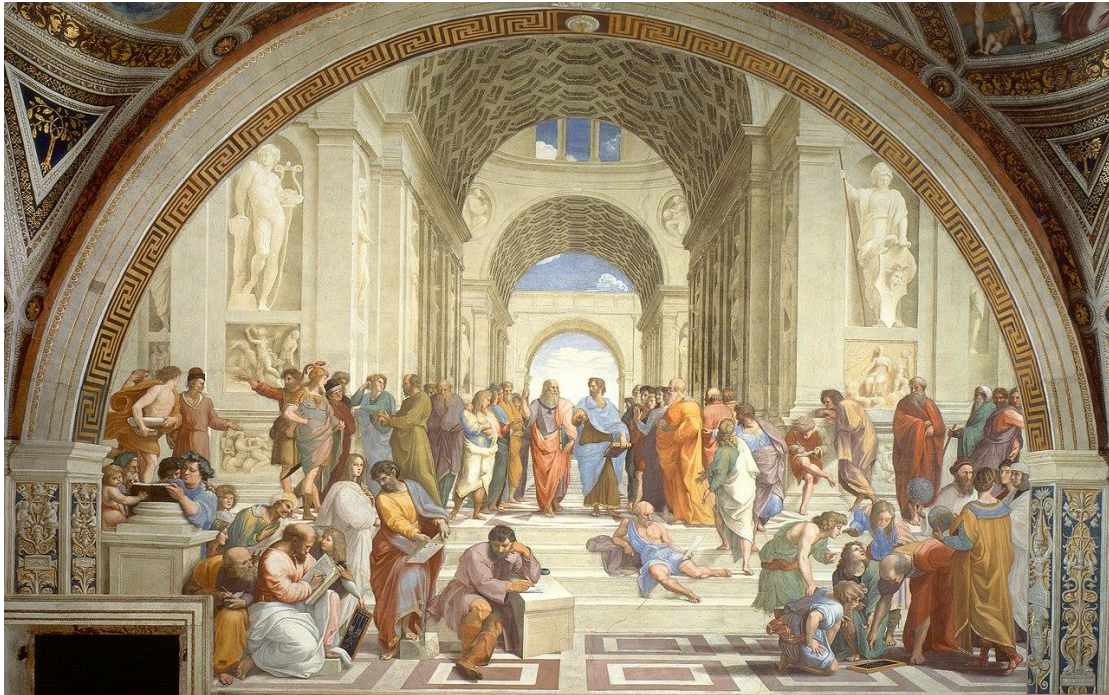
רפאל, האקדמיה של אתונה, פֶּרְסֵקוֹ (ציור קיר), שנת 1511, מאוסף הוותיקן, רומא.

התבוננו בציור המפורסם של רפאל, וקראו למטה על כמה מהדמויות בציור (חלקן באופן ודאי וחלקן כהשערה. מובן שלא כך נראו הדמויות בזמן. הכוונה היא למי התכוון האומן).