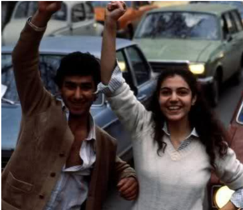
מפגינים בתקופת המהפכה באיראן, 1979