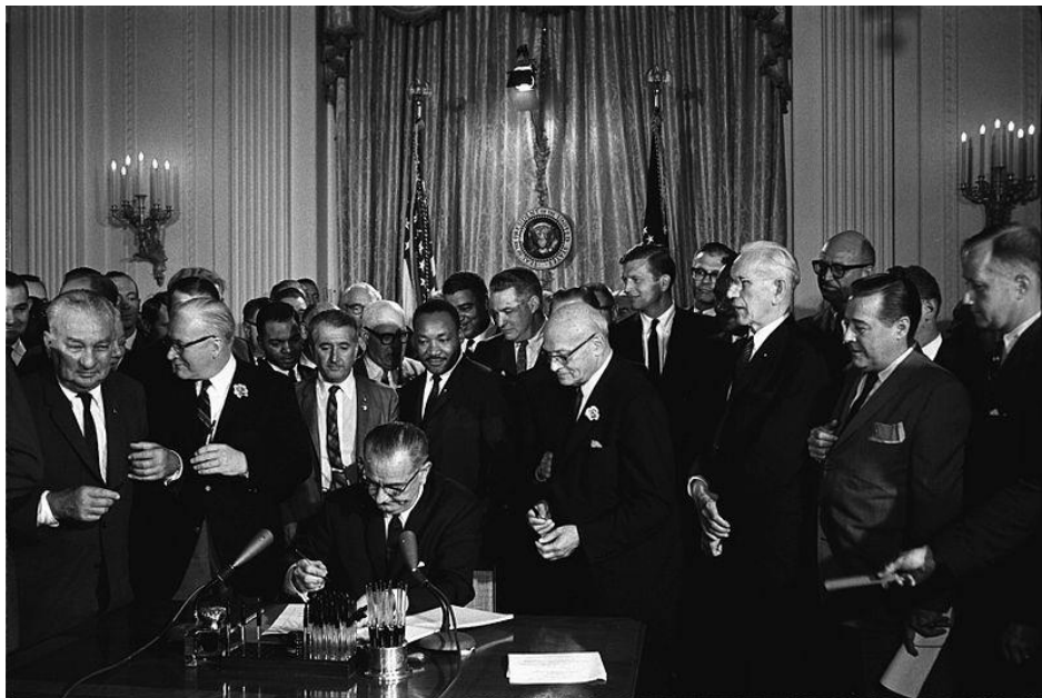
לינדון ג'ונסון, נשיא ארצות הברית, חותם על החוק לזכויות האזרח, יולי 1964. מאחוריו עומד מרטין לותר קינג.

פרס נובל לשלום פרס בינלאומי שמוענק מדי שנה למי שתרום תרומה חשובה לשלום העולם.