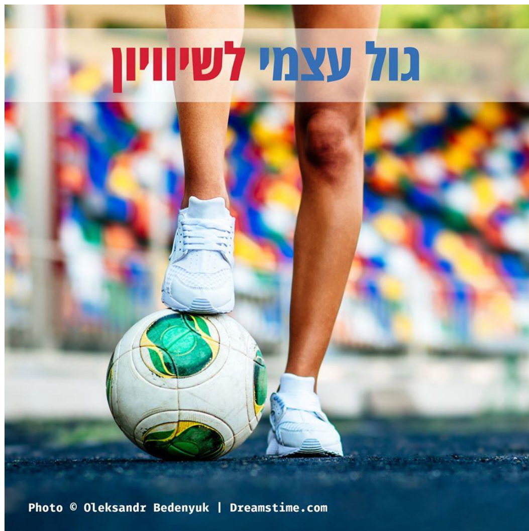
מתוך קמפיין של האגודה לזכויות האזרח בישראל