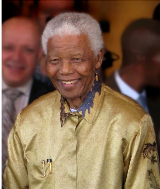
נלסון מנדלה, 2008

פרס נובל לשלום פרס בינלאומי שמוענק מדי שנה למי שתרום תרומה חשובה לשלום העולם.